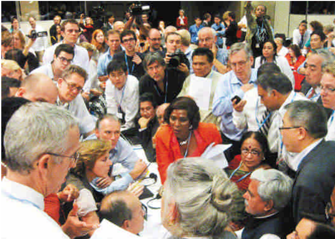
各國部長 2011/12/11 在南非德班召開的聯合國氣候變遷會議上，討論熱烈。

在南非德班舉行的聯合國氣候變遷會議，十一日在正式會議結束的兩天後終於達成協議，與會的一百九十四國代表同意歐盟提出的締結減碳新條約「路線圖」，在二〇一五年達成具有法律約束力的新條約，強制要求包含美國、中國大陸和印度在內的所有污染國家減少碳排放。